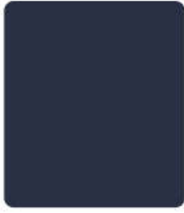
MORNING BLUE R967 ฟ้ารุ่งอรุณ