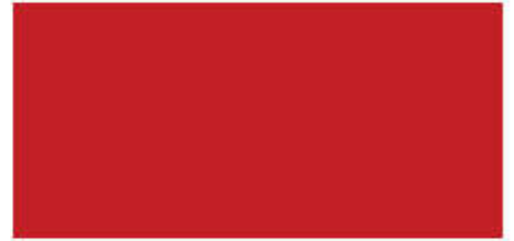
สีแดงมุก ▲ R 912