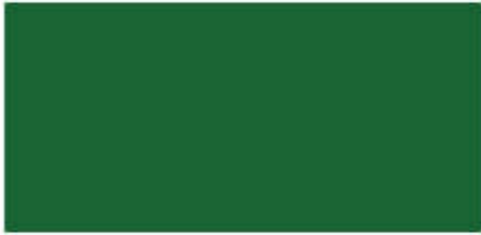
สีเขียวมรกตมุก ▲ R 914