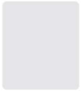
WHITE R921 ขาว