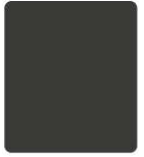
GREY R995 เทานกพิราบ