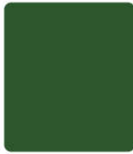
PLANT GREEN R955 เขียวพฤกษา