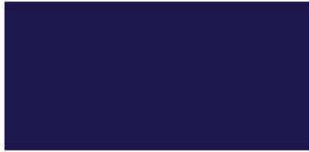
สีฟ้าโพธิ์นมุก ▲ R 916