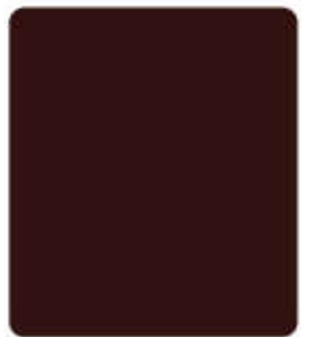
BROWN R929 น้ำตาลคลาสสิก

ตัวอย่างนี้ใกล้เคียงกับสีจริงเท่านั้น The colour patterns shown on this card are approximate only.