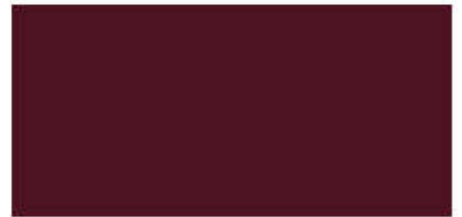
สีม่วงมุก ▲ R 913