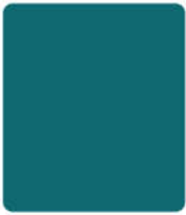
SHADY BLUE R968 ฟ้าร่มรื่น