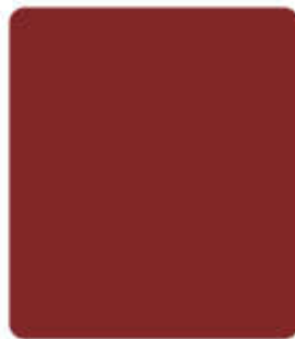
RUSTIC RED R926 แดงเอราวัณ