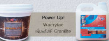
1. สีเนื้อ (Textures Paint) 3. สีสเล็คชั่น/เงา (Top coat)