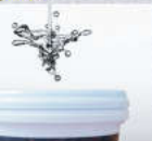
1. สำหรับรองพื้น มีสีรองพื้น 15-20% พื้น. ความหนาสีกับน้ำอีพอกซี