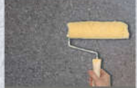
4. หลังจากพ่นสี ทั้งบริเวณแห้งสนิท (1-2 ชม.) ทายูรีเทนชั้น 1 รอบ

RPSC CHEMICAL CO., LTD. (THAILAND) 811-9038-9 Fax: (662) 811-9920 www.rpspaint.com FB: RPSCChemicals