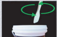
2. สำหรับสีแกรนิตไลท์ ใช้ไม้พายกวนสีอย่างช้าๆ จนเม็ดสีเข้ากันดี