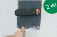
3. ใช้ลูกกลิ้ง, แปรง, เครื่องพ่นสี ตามความถนัดบนพื้นผิวที่เตรียม 1-2 เที่ยว